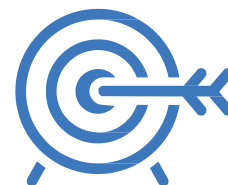
Figure apicali Manager Dir. B.U. Legali d'impresa

Il meeting muove dalla constatazione pratica della sempre maggiore rilevanza, nell'ambito delle gare pubbliche, dei risvolti di alcuni comportamenti tenuti dalle SSAA e dai soggetti operanti per conto delle imprese.